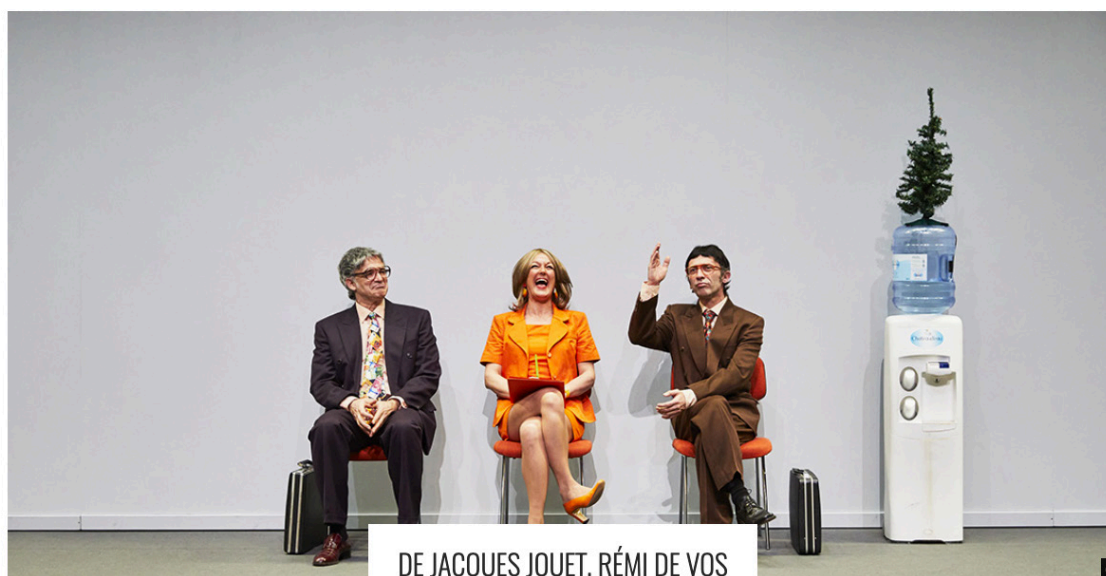
DE JACQUES JOUET, RÉMI DE VOS ET GEORGES PEREC / MES ANNE- LAURE LIÉGEOIS