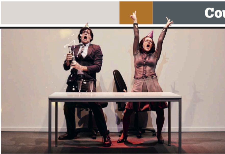
Les trois textes d'Entreprise servent un triptyque théâtral qui remonte le temps, sur les cinquante dernières années, pour sonder l'évolution du monde du travail et l'origine de la situation actuelle. Ici, L'Augmentation , d'après un texte de Georges Perec.