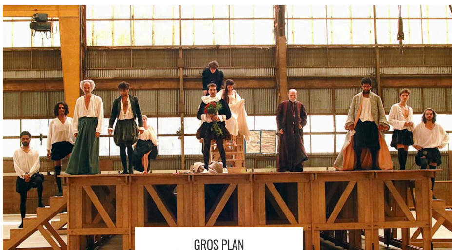
GROS PLAN D'APRÈS WILLIAM SHAKESPEARE / CONCEPTION ET MISE EN SCÈNE D'ANNE-LAURE LIÉGEOIS

Projet franco-marocain, la version trilingue de Roméo et Juliette élaborée par la Compagnie Le Festin défend l'idée d'un théâtre œuvrant pour le mélange des cultures.