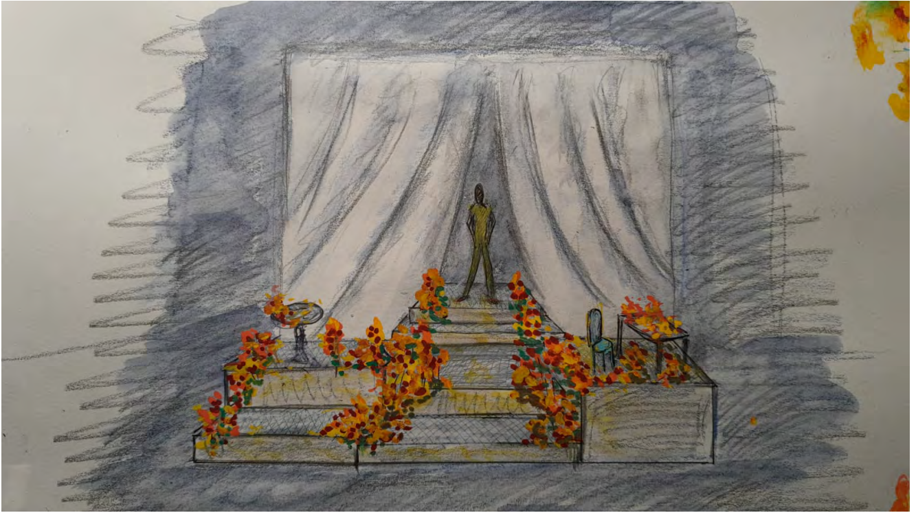
Dessin du décor par Renaud Lagier